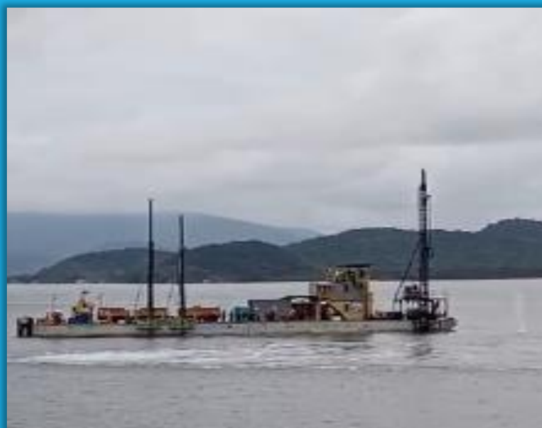
Momento da Etapa de Detonação – Funcionamento da Cortina de Bolhas