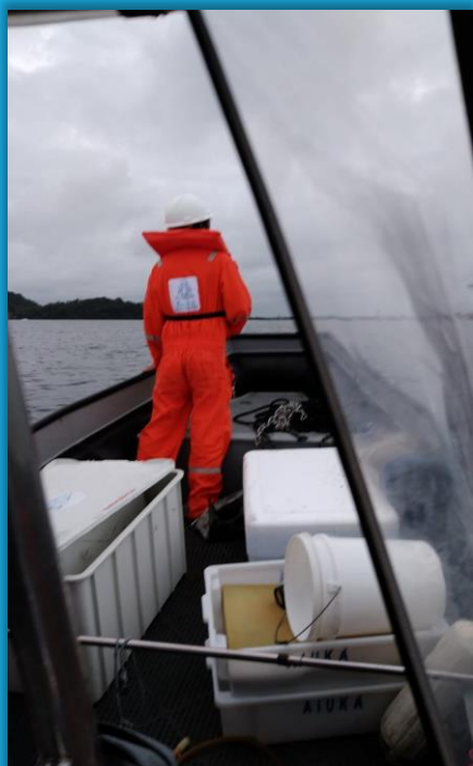
Varredura após detonação – sem constatação de animais debilitados