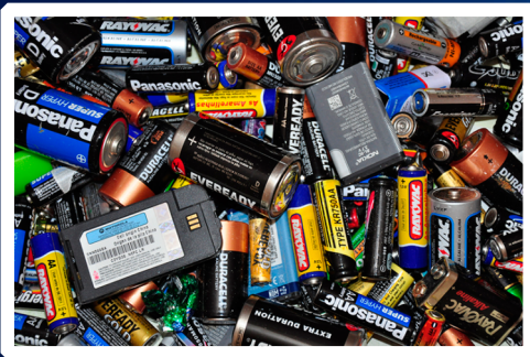
Pilhas e baterias

Estes são alguns exemplos dos tipos de resíduos que são comumente gerados em nossas casas e em nosso ambiente de trabalho.